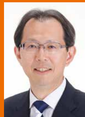
福島県知事 内堀 雅雄