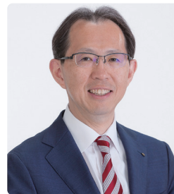
福島県知事 内堀 雅雄