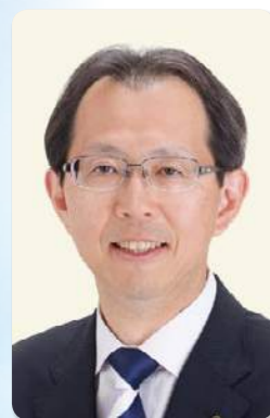
福島県知事 うちほり まさお 内堀 雅雄